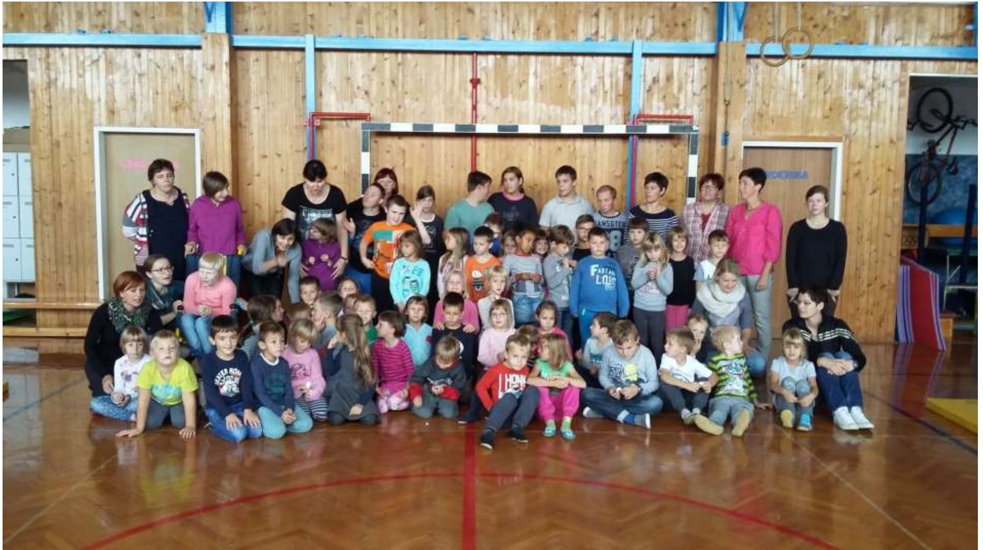
1. a in 1. b s prijatelji